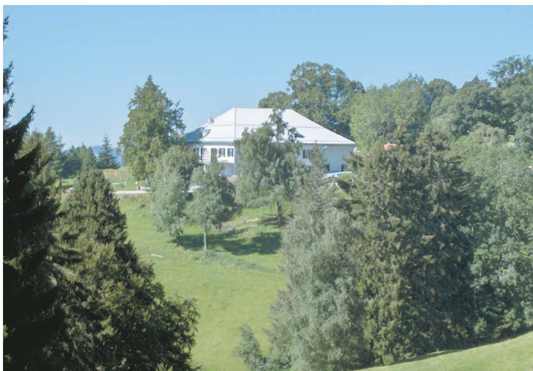
La Ferme La Bessonnaz

15 h Départ en car de Beznau vers Yverdon, Lignerolle, Lausanne et Genève